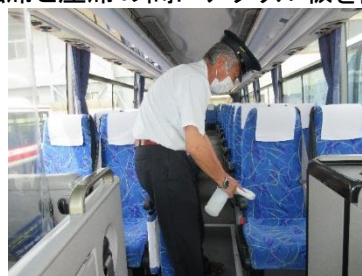
細部にわたり除菌、消毒