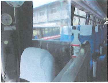
手指消毒用アルコール