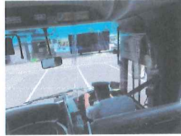
運転席（横・後）の亚克力板設置