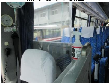
全車両に消毒液積み込み