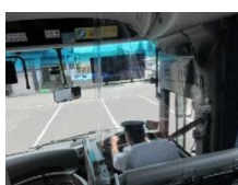
アクリル板設置(昼行便)