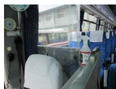
手指消毒用アルコール