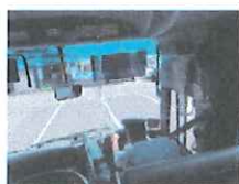
アクリル板設置(昼行便)