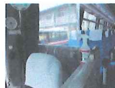
手指消毒用アルコール