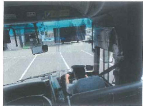
■ アクリル板設置（貸切・高速昼行便）