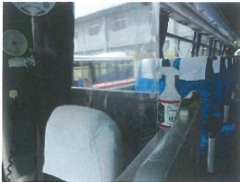
■ 手指消毒用アルコール